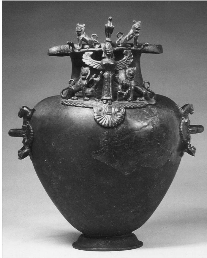
Abb. 1 Die Hydria von Grächwil – Importiertes Prunkgefäss aus Bronze mit der Darstellung der “Herrin der Tiere” um 570 v.Chr.

Das Leitobjekt aus der Eisenzeit ist die im unteritalischen Grossgriechenland bei Tarent gefertigte archaische Grächwiler Hydria (570 v.Chr.) (Abb.1). Auf der Schulter dieses Wassergefässes steht eine von Tieren umgebene Göttin, die Herrin der Tiere und der Jagd. Bei einem goldenen Gehänge kann man an den aufgelöteten Goldkügelchen unterscheiden zwischen etruskischer Wertarbeit und nachgearbeiteter Reparatur durch einheimische Kunsthandwerker. Derartige Luxusgüter aus dem Mittelmeerraum sind Zeichen der Macht der früher schon als keltisch definierten Fürsten und ihrer Verbindungen nach Süden über die Alpen hinweg.