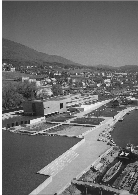
Abb. 2 Das 2001 eröffnete Laténium in Neuchâtel.

wickelten daher die Bäume ein entsprechendes Jahrringmuster. Setzt man die Jahrringabfolgen verschieden alter Holzfunde aus Moorhorizonten oder Flussschotter nach der Überlappungsmethode zusammen, so erhält man schließlich eine typische Ringabfolge, die Standardkurve. Die verschiedenen Eichenstandardkurven für Mitteleuropa reichen unterdessen 12.000 Jahre zurück.